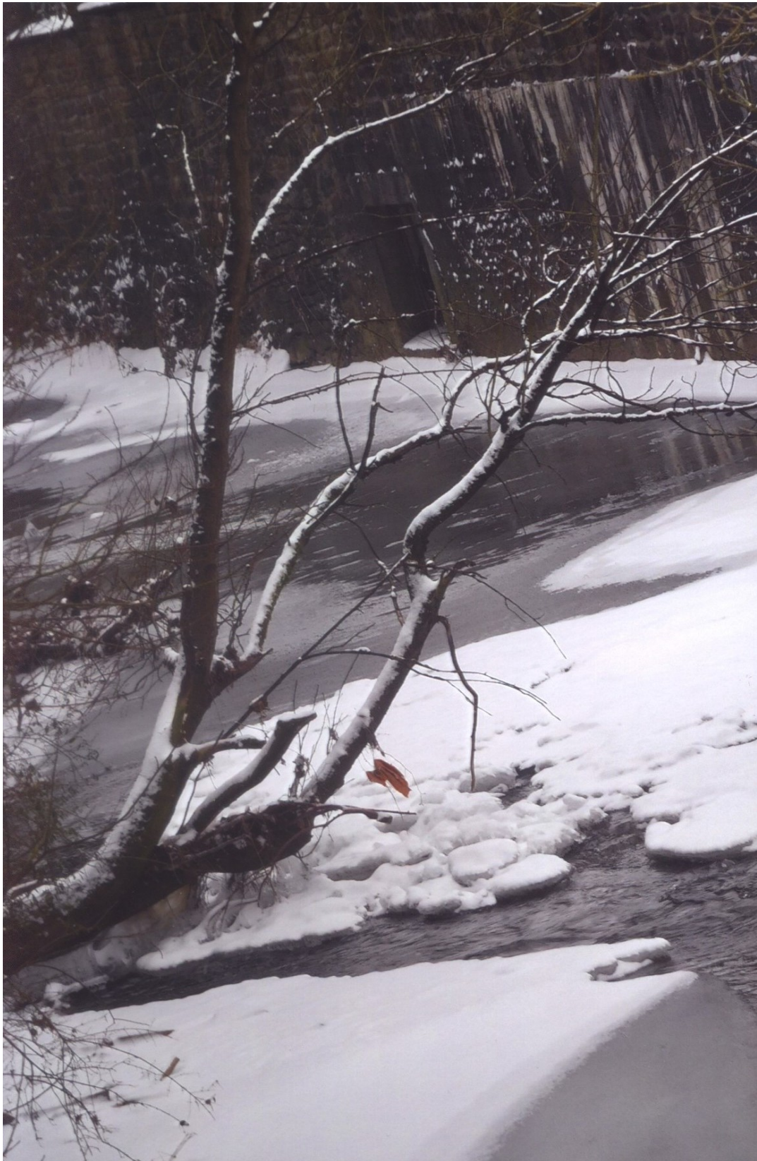
Hans-Peter Unruh: Winterimpressionen