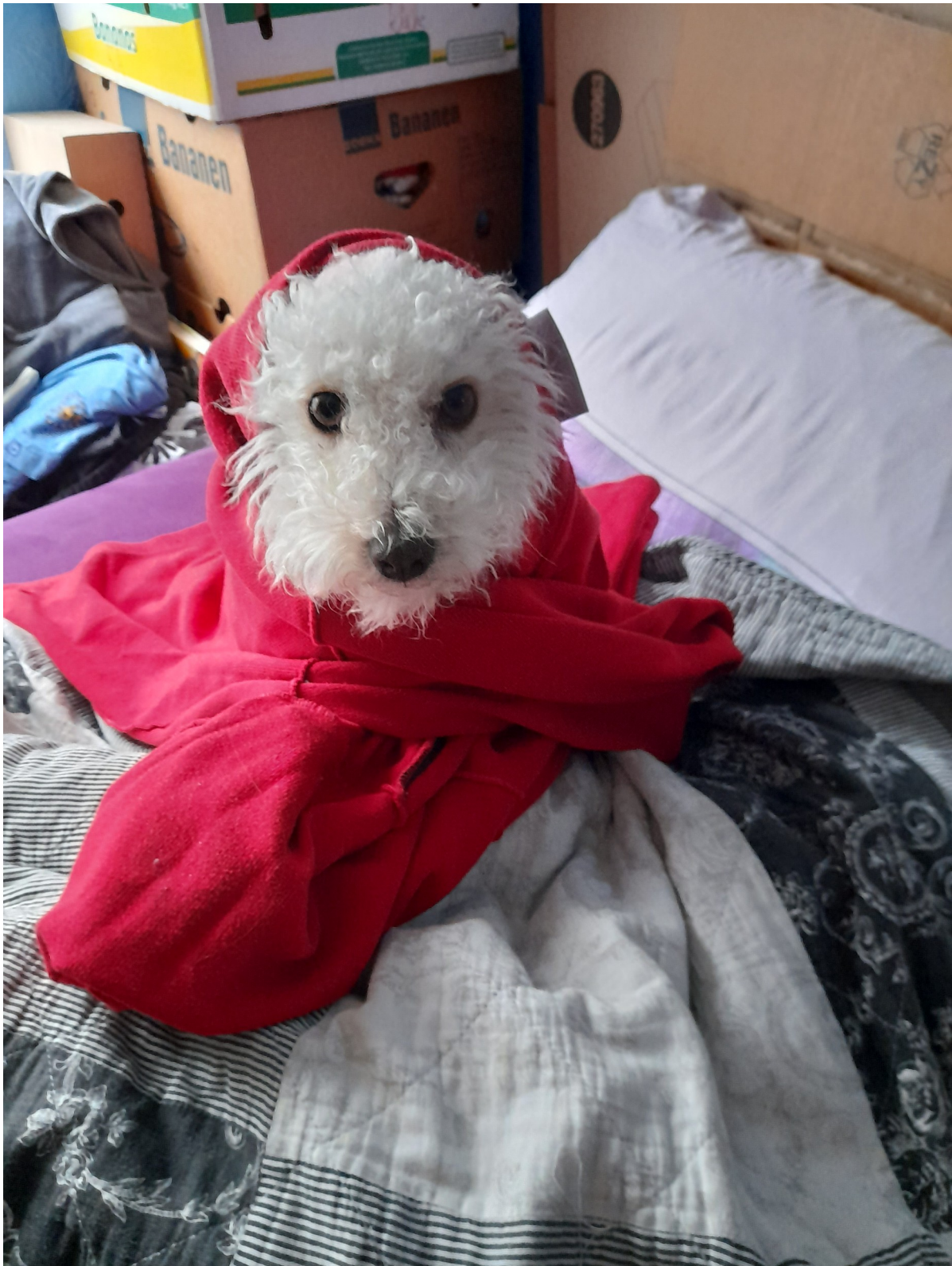
Gundula Rühle: Bonito, der SGN-Weihnachtshund