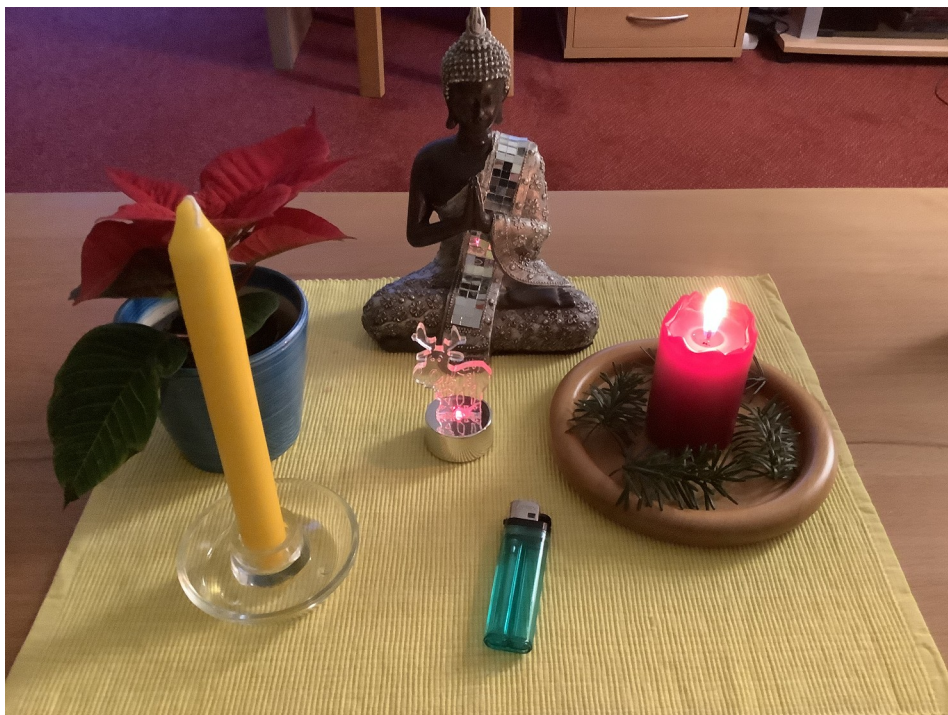
Sylvia Hellmich: Weihnachtliches Stilleben